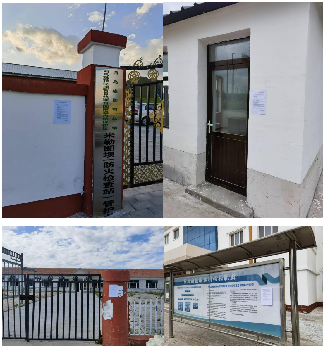
图 3-4 沿线各嘎查、苏木政务公开栏张贴公示照片

2023年9月19日~10月8日，我单位在项目沿线各嘎查、苏木政务公开栏张贴告示，对完成的环境影响评价征求意见稿进行二次公示，公示照片见图3-4。