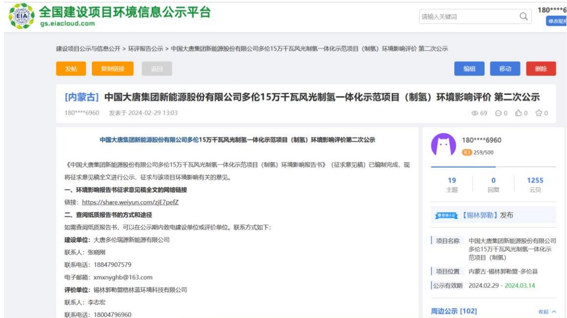
图 3.2-1 环境影响评价第二次公示证明

https://www.eiacloud.com/gs/detail/1?id=40229mnMVW