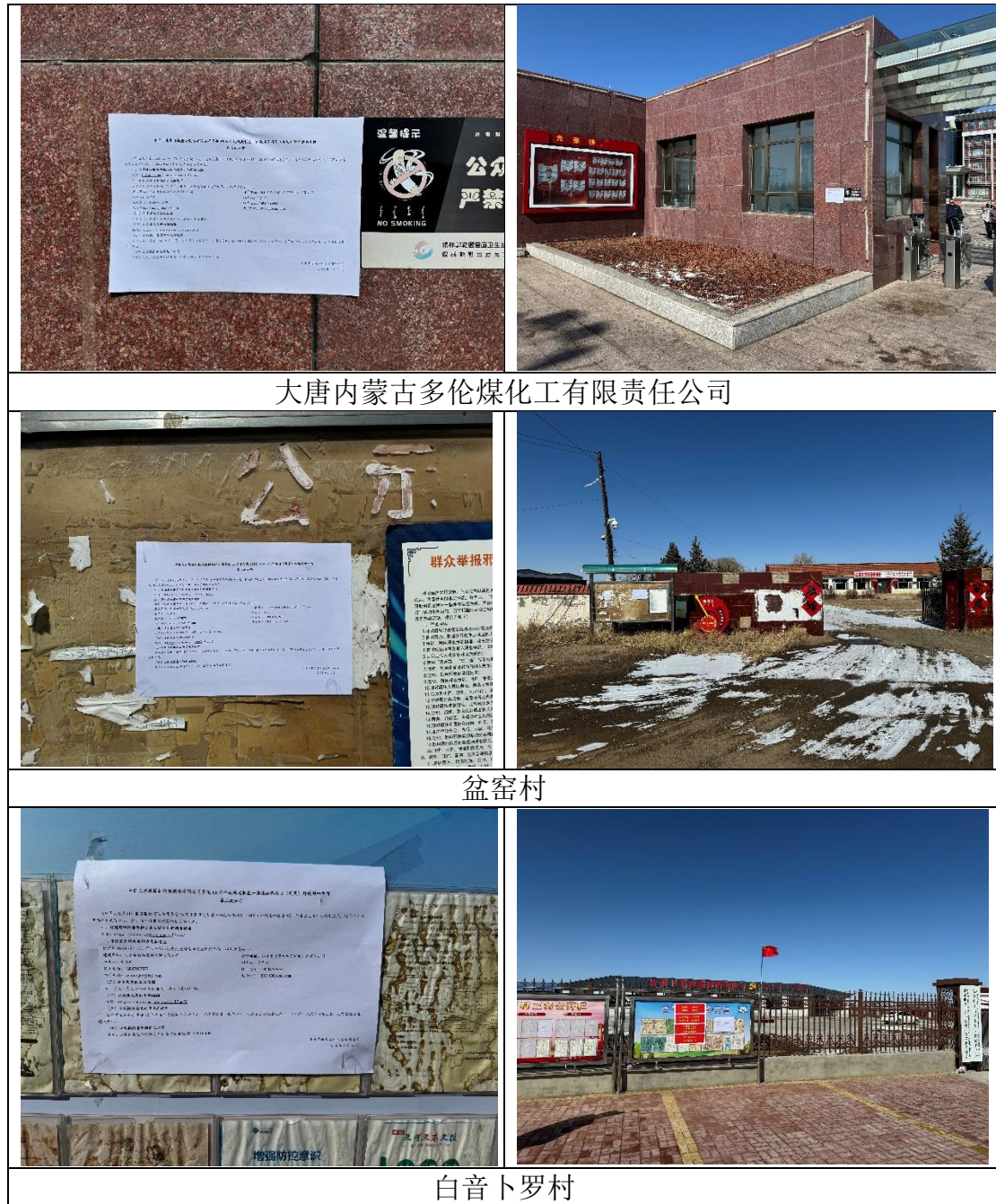
图 3.2-4 张贴公告现场照片

2024年2月29日~2024年3月14日，我公司在项目周边区域：大唐内蒙古多伦煤化工有限责任公司、盆窑村和白音卜罗村同步张贴公告进行公示，共计10个工作日。现场照片见下图。