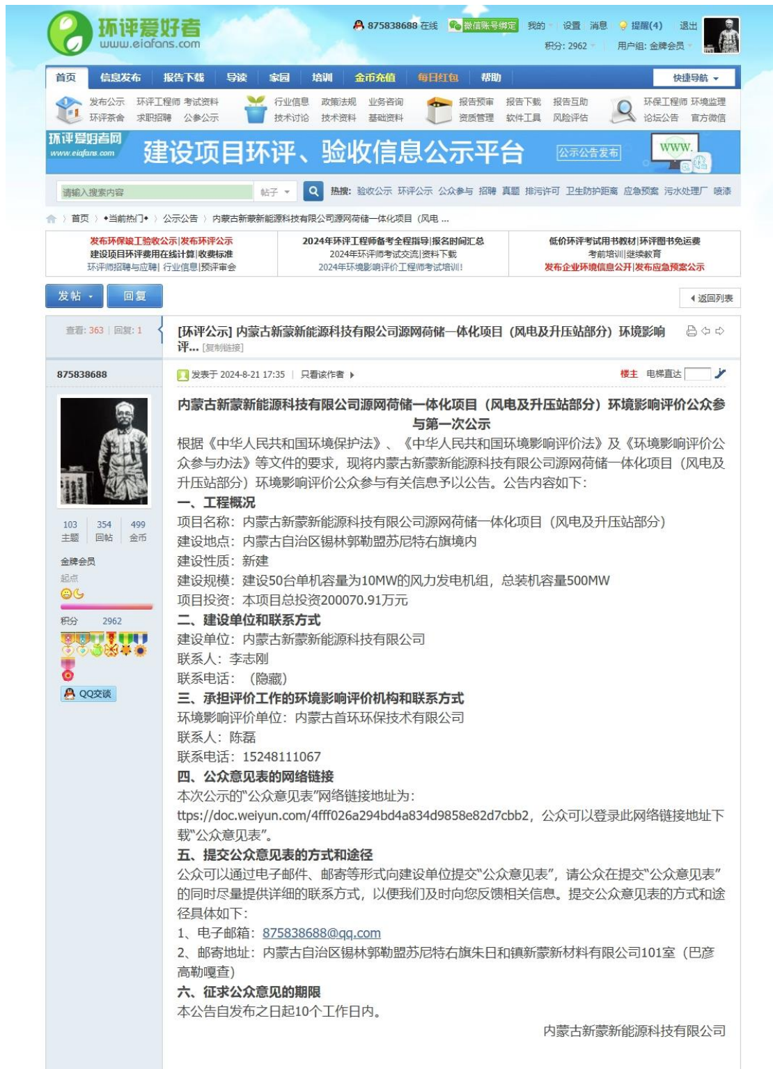
图 2.1-1 一次公示截图