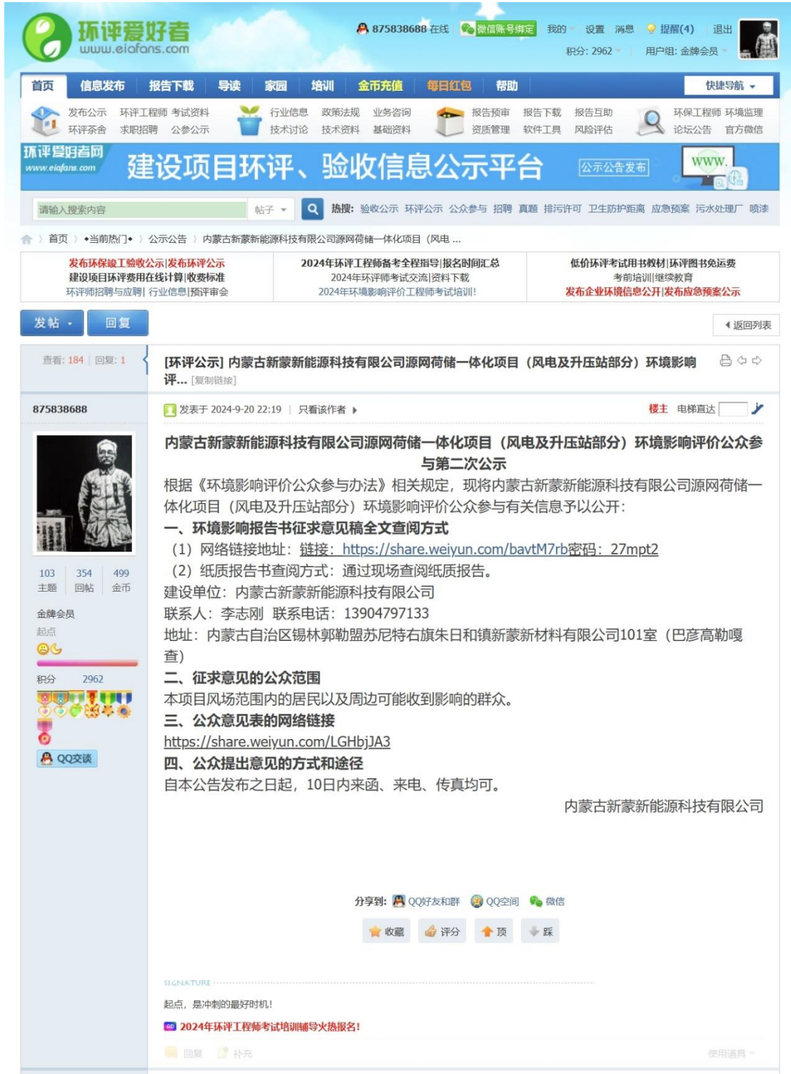
图 3.2-1 二次网络公示截图