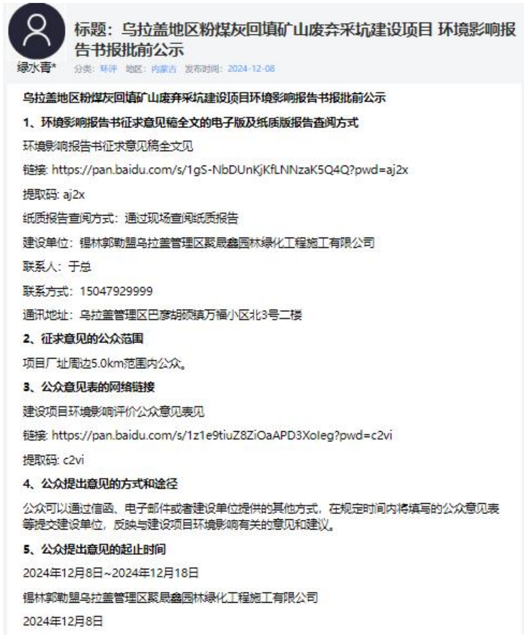
图5 报批前公示网页截图

乌拉盖管理区聚晟鑫粉煤灰综合利用建设项目环境影响评价信息公众参与报批前公示于2024年12月8日-12月18日在环保小智网站上进行公示，公示网络截图详见图5。